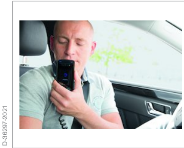
Messung der Atemalkoholkonzentration