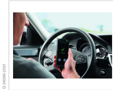
Akzeptierte Atemprobe: Startfreigabe