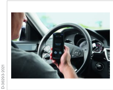
Aufforderung zur Abgabe der Atemprobe