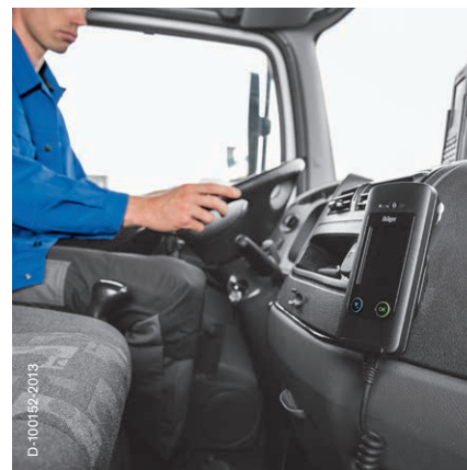
Einsatz im LKW