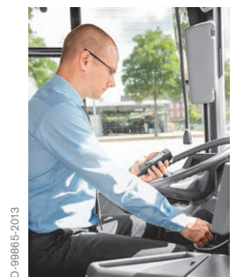
5. Motor starten