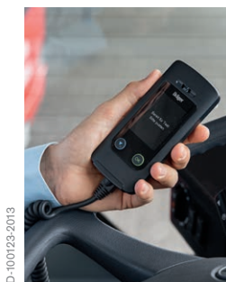
2. Abgabe des Atemtests nach vorheriger Aufforderung