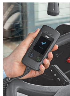
4. Akzeptierte Atemprobe: Freigabe des Anlassers