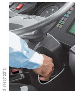
1. Zündung einschalten