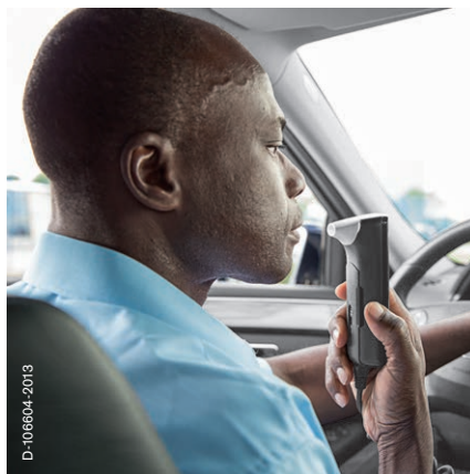
Einsatz im PKW