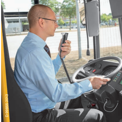
Einsatz im Bus

Atemalkoholsensitive Wegfahrsperrn von Dräger haben sich seit mehr als zwei Jahrzehnten weltweit erfolgreich etabliert.