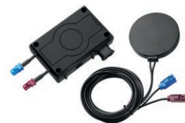
Kamera Interlock® 7000