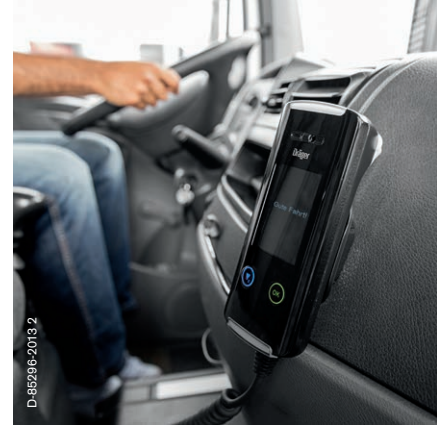
Einsatz im LKW