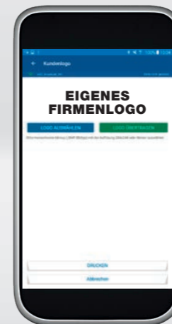
Eigenes Firmenlogo auf jedem Ausdruck