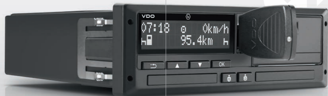
Optischer Trend: Negativdisplay für gute Ablesbarkeit