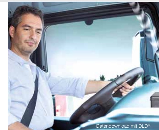
Datendownload mit DLD®