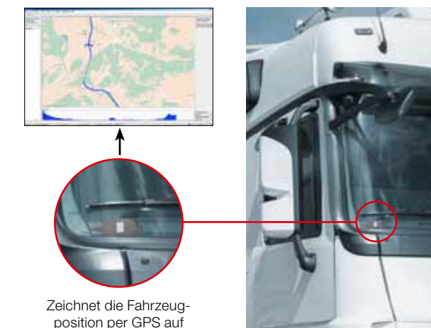
Zeichnet die Fahrzeugposition per GPS auf

Ein nachrüstbares GPS-Modul DTCO® GeoLoc wird als zweites unabhängiges Bewegungssignal genutzt und die Aufzeichnung der GPS-Position als neues Highlight um bis zu vier CAN-Informationen erweitert.